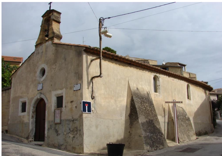
La Chapelle Notre Dame des Vignerons