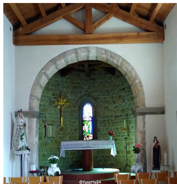
Intérieur de la Chapelle