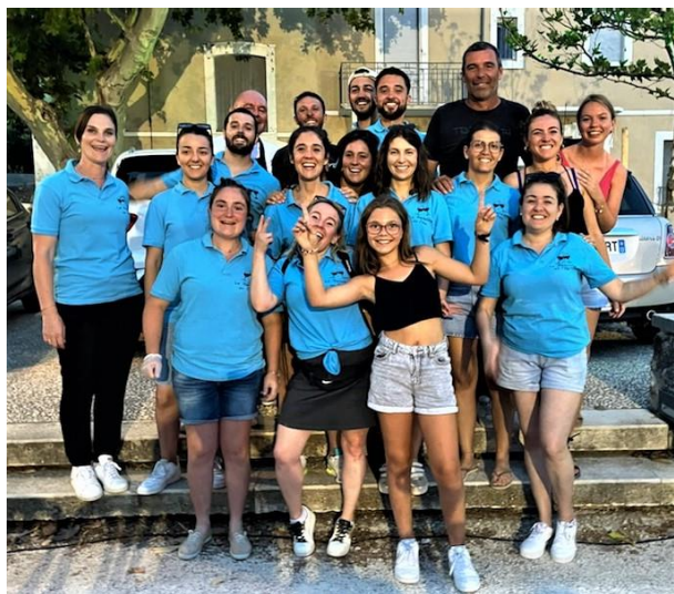
La Rastellaine en fête

Comme il est de coutume à Rasteau, l'été s'est déroulé sous le signe de la « fête ». Avec tout d'abord la fête votive qui fut, comme l'année précédente une grande réussite. La foule était au rendez-vous lors de ces quatre jours. Il faut dire que la présence des forains, désormais bien connus et appréciés surtout des plus jeunes, la grande qualité des groupes d'animation et les menus proposés par les associations organisatrices, concourraient à ce que ce soit un succès total et ce le fut.