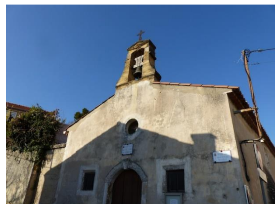
Chapelle des Vignerons