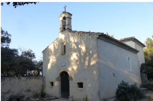
Chapelle St Didier