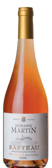
Domaine Martin VDN Rosé