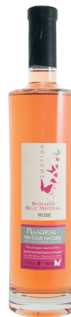
Domaine Beau Mistral VDN Rosé