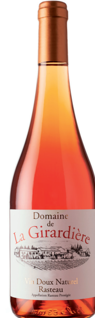
Domaine La Girardière VDN Rosé

Sa robe peut varier entre plusieurs tons de rose, du plus clair au plus soutenu. Les vins sont aromatiques avec des légères notes de fleurs blanches, de nectarine et de fraise. En bouche, le vin est très fruité avec des tannins souples et une excellente longueur.