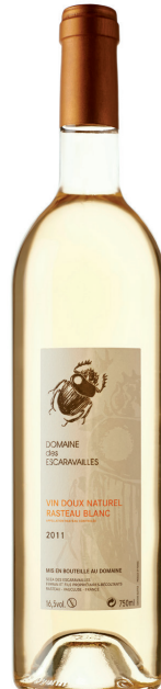
Domaine des Escaravailles VDN Blanc