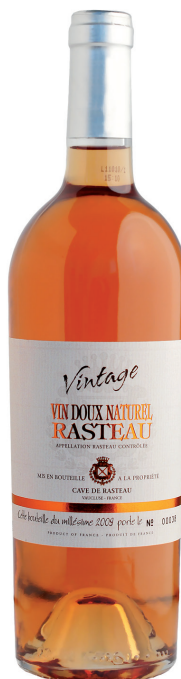
Cave des Vignerons de Rasteau ORTAS VDN Vintage

Le Rasteau Ambré présente une magnifique nuance de cuivre clair. Le nez est très expressif et complexe avec des notes de pain d'épices, de pruneaux, de noix de pécan, de fruits secs, de noyaux de cerises et une touche de caramel. En bouche, tous ces arômes sont confirmés avec des tannins très doux et une bonne longueur.