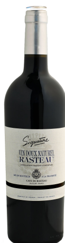
Cave des Vignerons de Rasteau ORTAS VDN Grenat