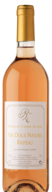
Domaine Combe Julière VDN Rosé