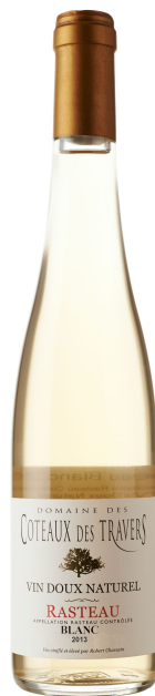
Domaine des Coteaux-des-Travers VDN Blanc

Peu de producteurs élaborent du VDN Rasteau blanc, mais ils présentent généralement la même couleur jaune pâle. Au nez, ils sont très aromatiques avec des notes d'agrumes, de citron et de poire. La bouche présente un équilibre parfait avec des saveurs de poire qui explosent en bouche, une belle acidité et une bonne longueur.