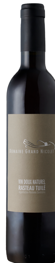
Domaine Grand Nicolet VDN Tuilé

Comme le Rasteau Blanc, il existe peu de Rasteau Tuilés, mais ils ont une séduisante couleur rouge-jaune profonde (acajou). Le nez de ces vins est très intense et complexe. Il y a des notes de café, de tabac blond, de dattes, de cacao, de pruneaux et de caramel. Ces mêmes arômes et les tannins sont bien présents en bouche, avec une belle longueur.