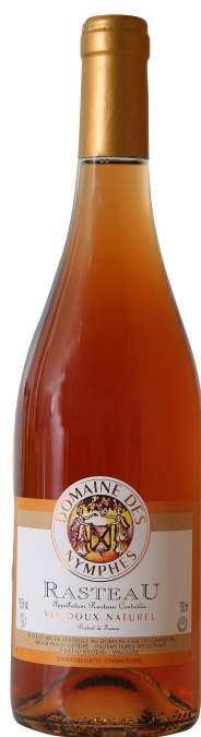
Domaine des Nymphes VDN Ambré hors d'Âge

Ce vin est rare, mais sa couleur est intrigante : légèrement floue, avec au centre une subtile couleur rouge-jaune (comme l'acajou) et un reflet jaune-vert sur les contours. Le nez de ce vin est comme sa couleur, c'est-à-dire complexe et intrigant. Il y a des notes de noix, de tourbe, de champignons, de pruneaux, de fruits secs et d'épices.